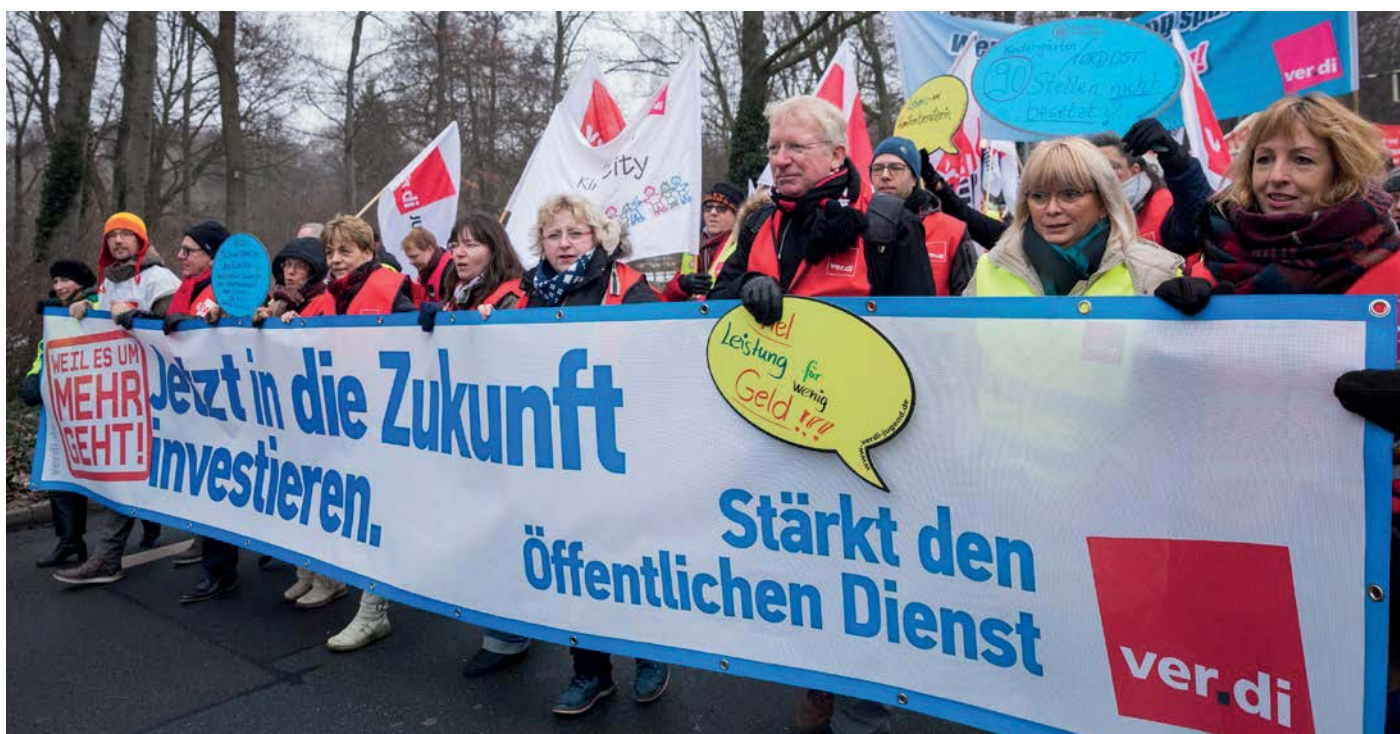
Demonstration zum Auftakt der Tarifverhandlungen in Berlin