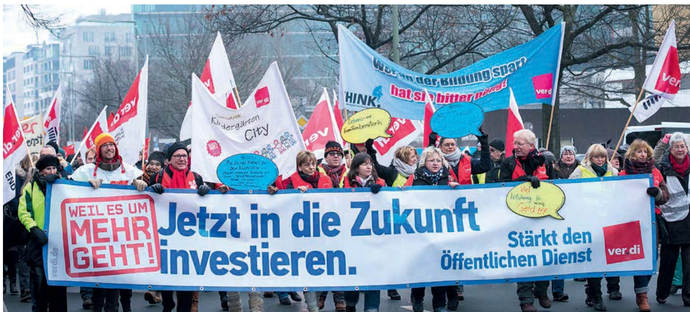
Kolleginnen und Kollegen demonstrieren vor Beginn der Verhandlungen in Berlin für ihre Forderungen.

Unsere Forderung nach Anschluss an die Einkommensentwicklung in der Privatwirtschaft ist mehr als berechtigt.